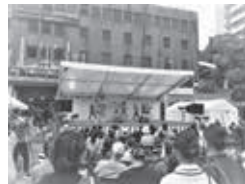
※画像は過去開催のものです。

詳細はすいたうんHP( https://sui-town.com/ )をご覧ください。