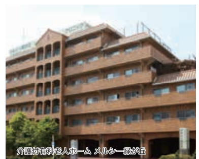
介護付有料老人ホーム ヌルシー健が丘