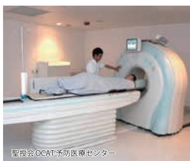
聖授会 OCAT 予防医療センター