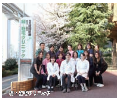
総・在宅クリニック