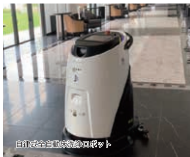
自律式全自動床洗浄ロボット