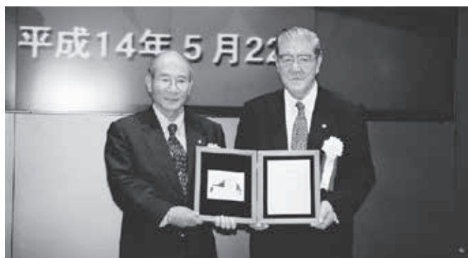
2002年5月東証二部に上場