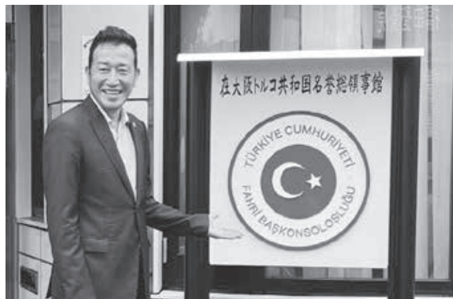
在大阪トルコ共和国名誉総領事館にて