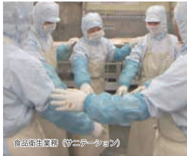
食品衛生業務（サニテーション）