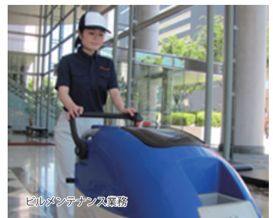
ビルメンテナンス業務