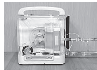
体外式模型人口肺(ECMO)