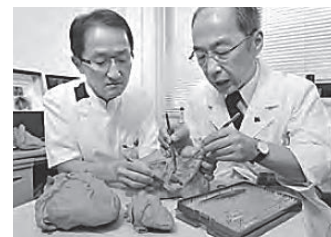
実物大3D心臓モデル