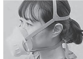
医療用高性能マスク