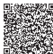
電子申込システム