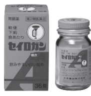
セイロガンA 第2類医薬品