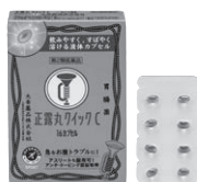
正露丸クイック 第2類医薬品