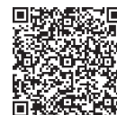
詳細はホームページをご覧ください