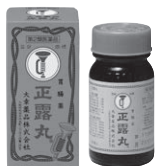
正露丸 第2類医薬品