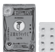
正露丸クイック 第2類医薬品