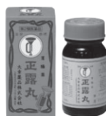
正露丸 第2類医薬品