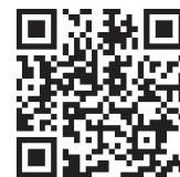
①専用ホームページ